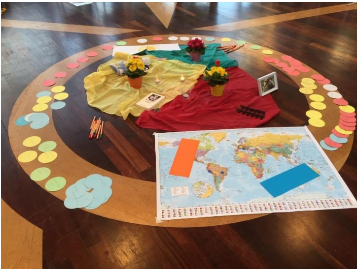
Impression vom Ehevorbereitungswochenende in Liestal Bruder Klaus